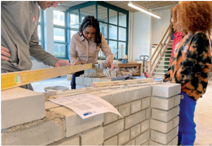
Kompass D zu Besuch im BZB

auch Kultur-AGs oder Kompetenzanalysen helfen den Lernenden, ihre neue Heimat und deren Wirkmechanismen besser zu verstehen und damit ihren Platz in unserer Gesellschaft zu finden. Und auch ein Besuch mit sachkundiger Führung im Quirinus Münster Neuss, Kölner Dom, der Kaiserstadt Aachen oder Haus der Geschichte in Bonn darf nicht fehlen.