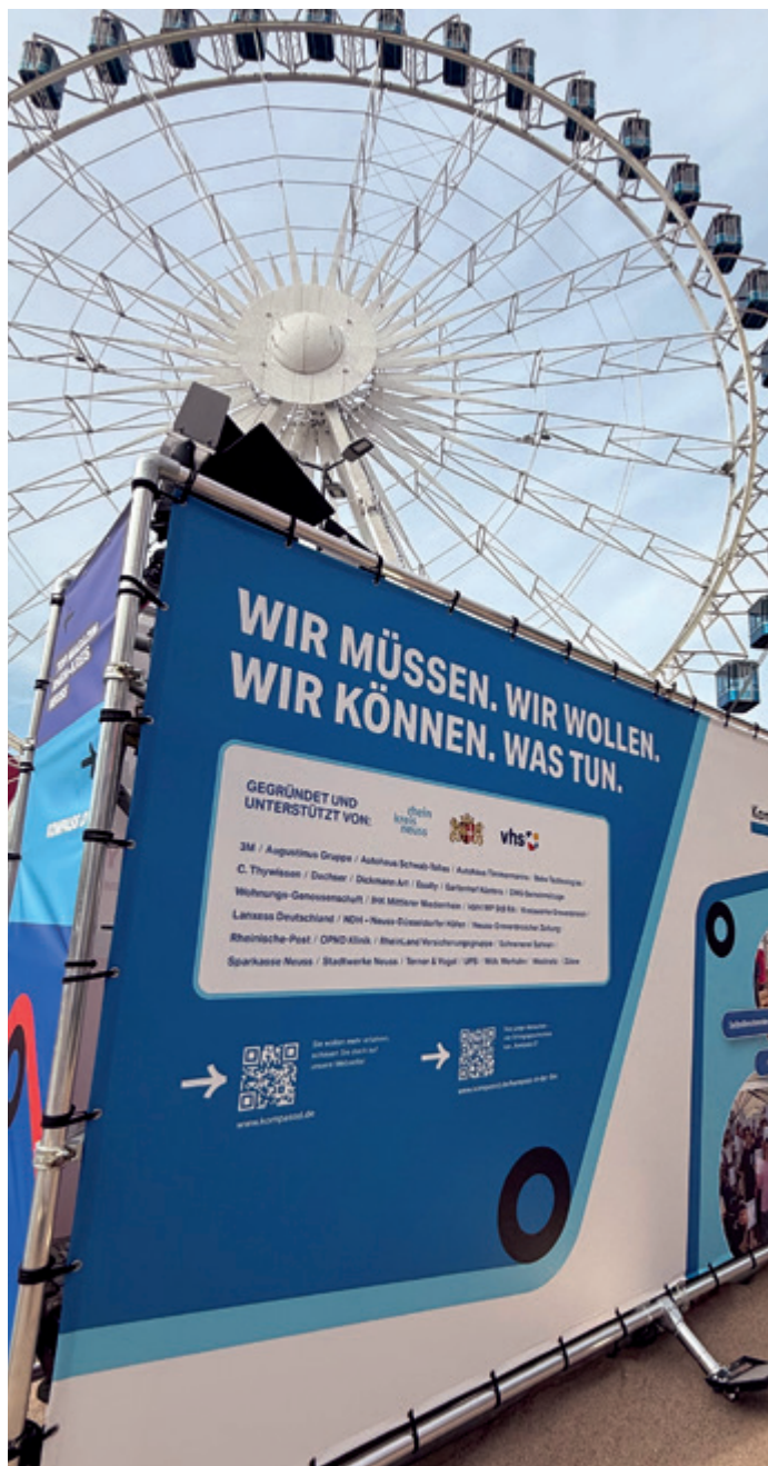
Kompass D als Partner des IHK Campus Zukunft