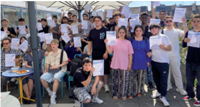
Lohn für ein Jahr Mühen – Kompass D verleiht Zertifikate