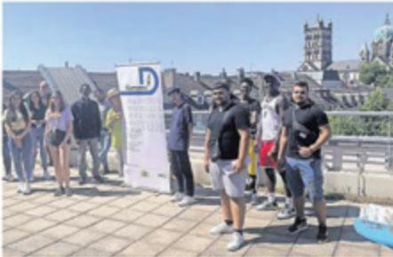
Geschafft: Zwei Wochen haben 18 junge Leute während der Sommerferien zusätzlich gebüffelt und dafür ein Zertifikat erhalten.

Erst im vergangenen Juni war 35 jungen Leuten in einer kleinen Feierstunde ihr Zertifikat überreicht worden. Ein Jahr zuvor waren es sogar 67 Absolventen gewesen. Eine Zahl, die die Initiatoren eigentlich 2020 übertreffen wollten, um so noch mehr jungen Leuten mit Migrationshintergrund größere Chancen für eine Ausbildung mit auf den Weg in ihre Zukunft zu geben. Leider machte Corona dem ambitionierten Vorhaben einen gewaltigen Strich durch die Rechnung. Doch es werden weitere Lehrgänge angeboten, die Zahl kann also durchaus noch wachsen.