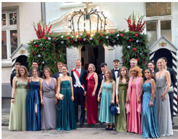
Vier junge Menschen im Hofstaat des Schützenkönigs 2023