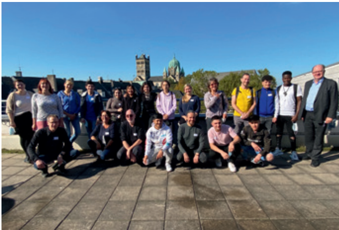
Kompass D LeseMentoren von „3M“ mit ihren Mentees

Die Idee, LeseMentor Neuss und Kompass D zu verbinden kam über zufällige Personenidentität der Organisatoren zustande. Hintergrund war und ist die Beobachtung, dass im Fall des