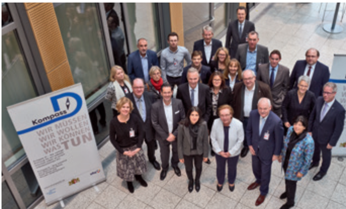
Serap Güler (vorne, 4. v.r.), Staatssekretärin für Integration NRW, beim Treffen des Kompass D Lenkungs- und Geberkreises im Jahr 2019