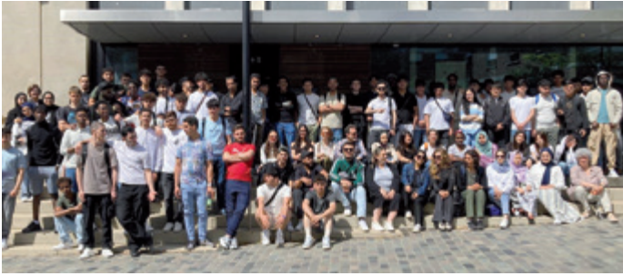
Auf historischem Boden – Kompass D in der Stadt Karls des Großen

Teilnahme und auf jeden Fall für einen guten Start in ein zielführendes Erwerbsleben.