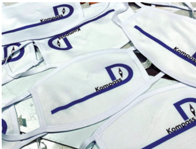
Kompass D trotz Corona

Auf Grund der vorgegebenen Hygiene- und Gesundheitsmaßnahmen sehen sich die mit Kompass D kooperierenden Schulen nicht in der Lage, Kompass D in gewohntem Maße Unterrichts-räume zu stellen, da sie den geregelten Unterricht auch auf den