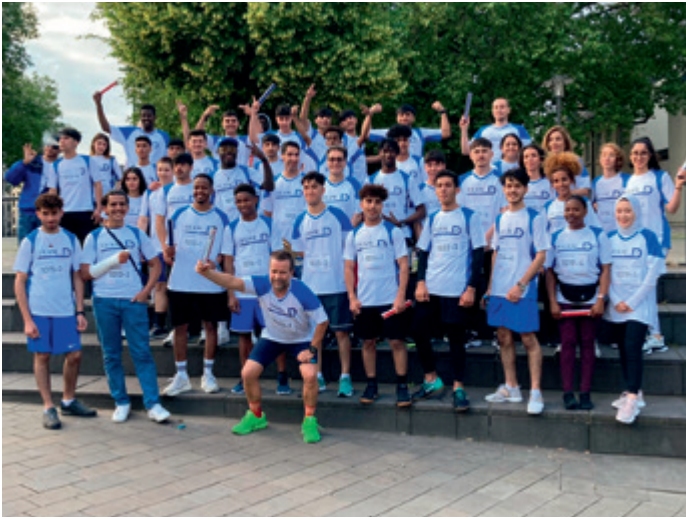
Elf Kompass D Staffeln beim Sommernachtslauf 2024

Präsenz aber nicht nur bei Laufveranstaltungen – auch auf dem Fest der Kulturen zeigt Kompass D Flagge. Henna-Malen, Blumengestecke kreieren oder aber – für Sportliche – der Kampf mit dem Plank Pad. Auch so lernt man sich besser kennen. Es ist immer was los bei Kompass D.