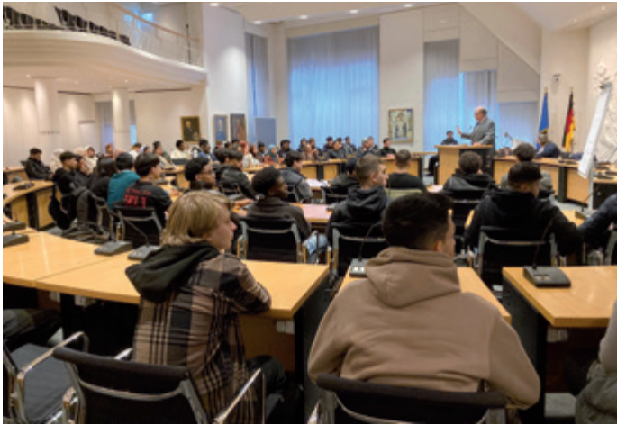
Gelebte Demokratie – Wahl des Kompass D Sprechers im Neusser Ratssaal

jungen Menschen, die freiwillig nach dem eigentlichen Schulunterricht an Kompass D teilnehmen, in Gesellschaftskunde, Politik, Geschichte und Arbeitskunde ihrer neuen Heimat. Das gründliche deutsche Ausbildungssystem muss auch oft und genau vermittelt werden, da es kaum Länder außerhalb Europas gibt, die solch ein, bei uns bewährtes System der Berufsbildung, kennen. Im Rahmen des Kompass D Unterrichtes besuchen die Teilnehmenden deshalb Unternehmen, lernen Wirtschaft und Unternehmer vor Ort kennen und haben dort die Gelegenheit, für sich selbst Berufsfelder zu erkunden und Kontakt zu Entscheidern aufzubauen.