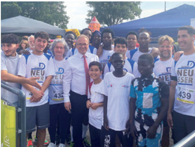
Kompass D mit Bürgermeister Breuer beim Integrationslauf 2025

Ein ursprünglich nicht beabsichtigter Nebeneffekt: bei dieser und aller weiteren Laufveranstaltungen war man sichtbar für die Menschen am Straßenrand und in der Läufer­schar. Von Anfang an, in verschiedenen Designs, prangte der blau/weiße Kompass D Schriftzug auf den Shirts und Trikots der Teilnehmenden, die an den Start gingen und gehen werden.