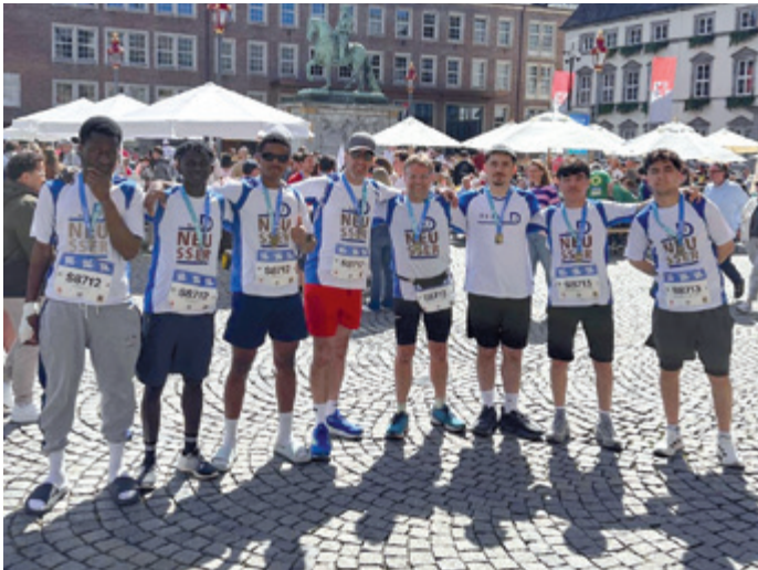
Erfolgreiche Teilnahme am Düsseldorf Marathon

Und auch beim Neusser Sommernachtslauf der TG Neuss ist Kompass D in jedem Jahr mit mehreren Staffeln, aber auch Einzelläufern vertreten. Neben der ersten Teilnahme von 8 Teilnehmenden an der 15km Distanz beim Neusser Erftlauf, starteten 2026 erstmals auch zwei Staffeln beim Düsseldorf Marathon – das Ziel: Marathonteilnahme 2027.