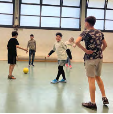
Hier zählen nicht nur Tore: Die Kinder lernen, fair miteinander umzugehen.