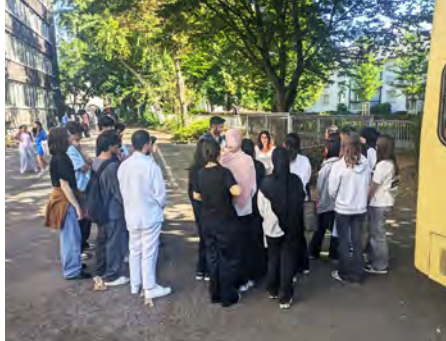
HörBus: eine mobile Ausstellung für Schulhöfe