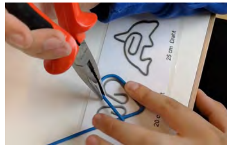
Handwerkliches Geschick ist gefragt.