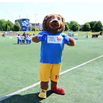
Mit dabei ist auch Litti, das Maskottchen von LitCam.