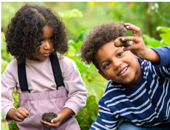
Selbst geerntet, schmeckt besonders lecker.