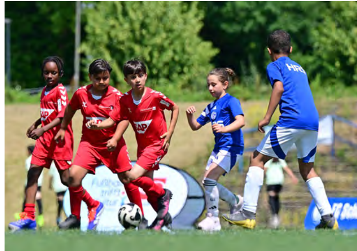
Beim Abschlussturnier erhält das Team aus Köln den Fair-Play-Pokal.