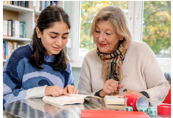
Bildung beginnt mit dem Verstehen von Texten.

„LeseMentor Neuss“ wurde von der Werhahn Stiftung vor 13 Jahren gegründet, heute engagieren sich hier ehrenamtlich mehr als 165 Frauen und Männer.