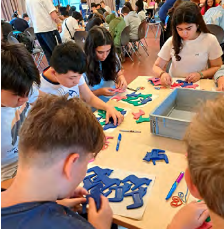
Einfach ausprobieren: Die Schüler*innen testen verschiedene Tätigkeiten.