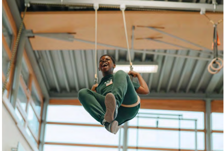
Wer sich in einer Gruppe sicher fühlt, traut sich in schwindelerregende Höhen.

Freundschaften schließen, neue Aktivitäten ausprobieren und sich sicher fühlen – das alles sollte zu einer normalen Kindheit und Jugend dazu gehören. Doch das tut es leider nicht immer. Gerade wenn Familien unter schwierigen Lebensverhältnissen leiden, wenn zu wenig Geld da ist oder andere Faktoren den Alltag der Eltern belasten, ist eine unbeschwertere Kindheit keine Selbstverständlichkeit. Die Folgen für die Kinder sind häufig Schwierigkeiten in der Schule, Konflikte mit Mitschüler*innen, soziale Ausgrenzung und Isolation.