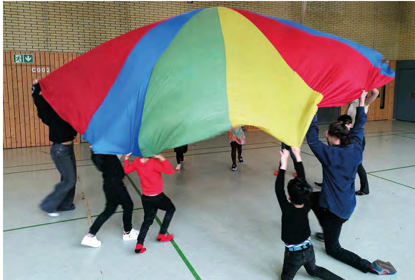
Mit kreativen Spielformaten macht Bewegung Spaß.

Kölner Spielewerkstatt zeigt mit ihrer Bewegungsbaustelle, wie sportliche Aktivitäten die Lernbereitschaft von Kindern verbessern.