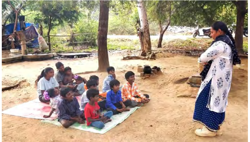
Auch für die Kinder der Musahar-Großfamilie

In Indien ist das Kastensystem offiziell abgeschafft. Trotzdem hält sich die Vorstellung, dass Menschen aufgrund ihrer Geburt zu einer bestimmten Gruppe gehören, hartnäckig in der Bevölkerung. Eine der ärmsten Kasten ist die Gemeinschaft der Musahar, was übersetzt Rattenfänger oder Rattenfresser bedeutet. Um zu überleben, haben die Angehörigen dieser Kaste früher auf den Feldern der Bauern Ratten gefangen. Bis heute leben die Musahar, die historisch zu den „Unberührbaren“ gehören, oft weit unter der Armutsgrenze und sind starker Diskriminierung ausgesetzt.