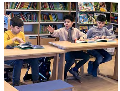
Die Kinder sind ein Team, auf dem Platz und in der Klasse.