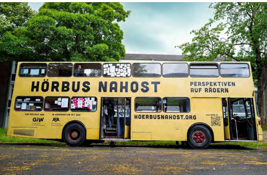
Ein multimedialer Ausstellungsraum: Viel Platz für verschiedene Perspektiven

Viele, vor allem junge Menschen, leben heute in ihrer eigenen Social-Media-Blase. Sie konsumieren Nachrichten und Meinungen, die das eigene Weltbild untermauern. Andersdenkenden zuzuhören und widersprüchliche Standpunkte auszuhalten, fällt oft schwer. Doch genau diese Fähigkeiten braucht eine Demokratie. Deshalb haben Schüler*innen der Gesamtschule Nordstadt Neuss gemeinsam mit zwei Lehrkräften die multimediale Ausstellung „Hörbar. Stimmen zu Nahost“ entwickelt. Sie befasst sich mit einem der komplexesten Konflikte unserer Zeit, dem oft gewaltvoll ausgetragenen Streit zwischen Israelis und Palästinensern.