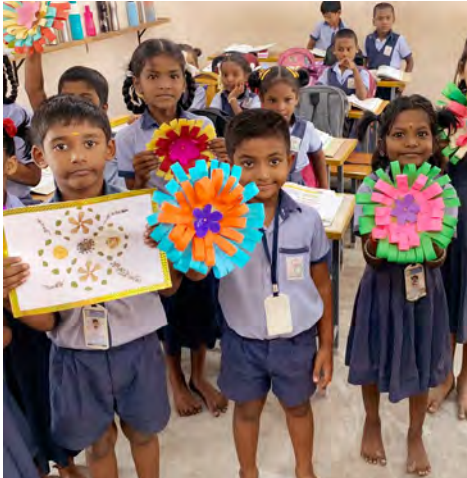
Play- und Awareness-Aktivitäten

Direkte Hilfe und Zukunftschancen: Die ZWILLING Foundation unterstützt eine Gruppe von Musahar, eine der ärmsten Kasten Indiens.